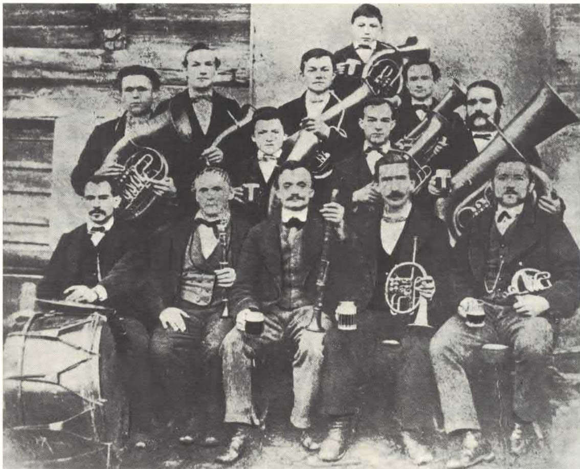
Gründungskapelle aus dem Jahre 1872