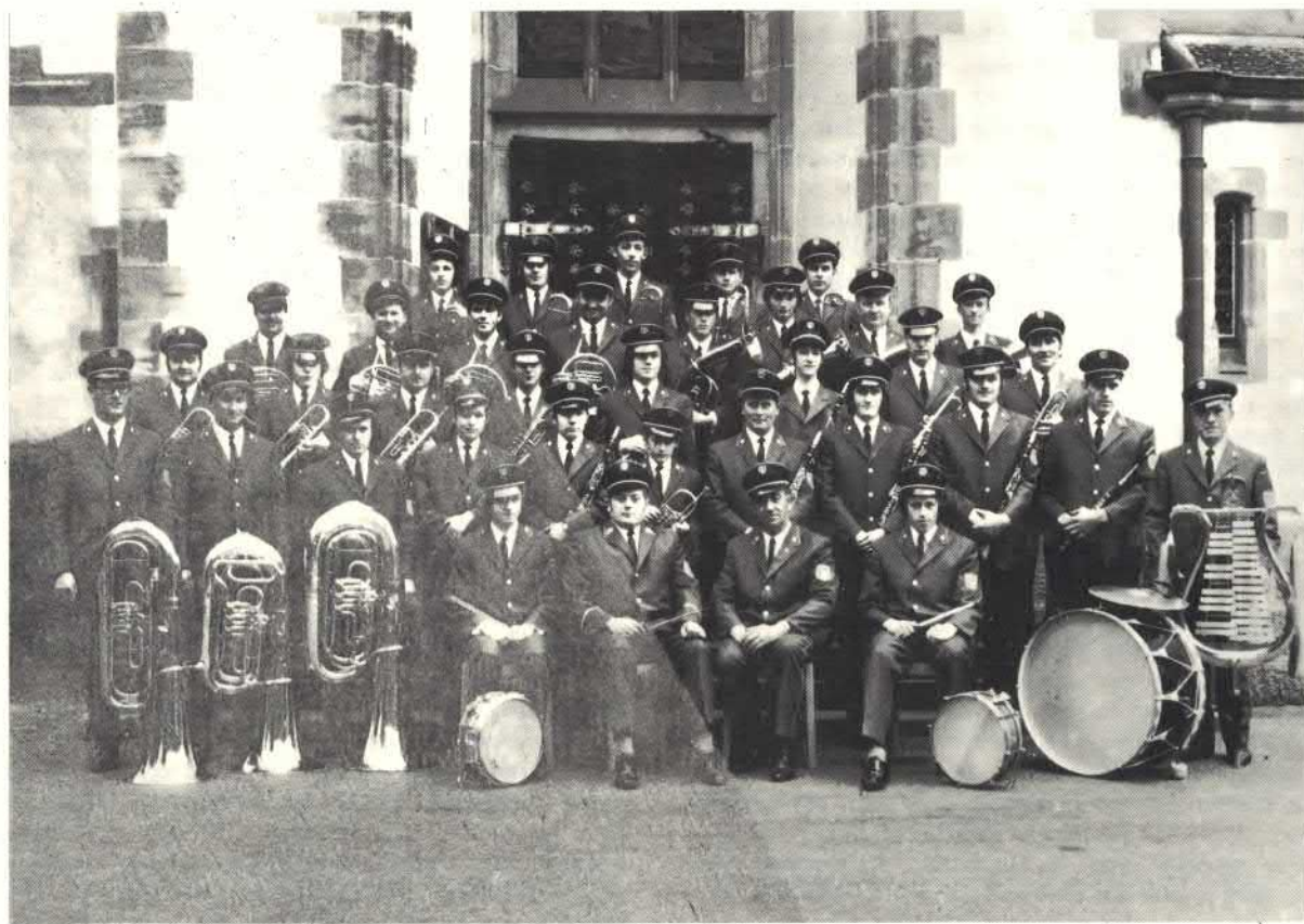
Die Jubiläumskapelle im Jahre 1972